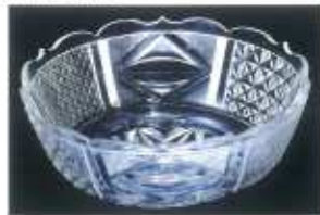
左上：浮世絵「御側御の歌麿 ばくれん」(喜多川歌麿/中古コレクション) 左下：江戸時代の切子ガラス、個人蔵 右上：薩摩切子「緑色切子鉢・紅色切子碗」、向古美術館蔵 コラム：七尾市選升1号機出土「ガラス」

こうして江戸から薩摩へ切子技術が伝播した。薩摩切子の特徴でもある厚い着色ガラスを被せた上からカットし、ぼかし加工を施す技術は質実剛健の薩摩の侍ならではの技法と言えるよう。